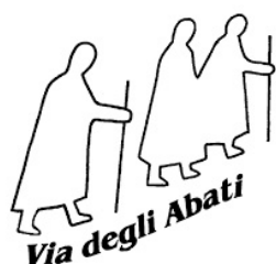
Via degli Abati