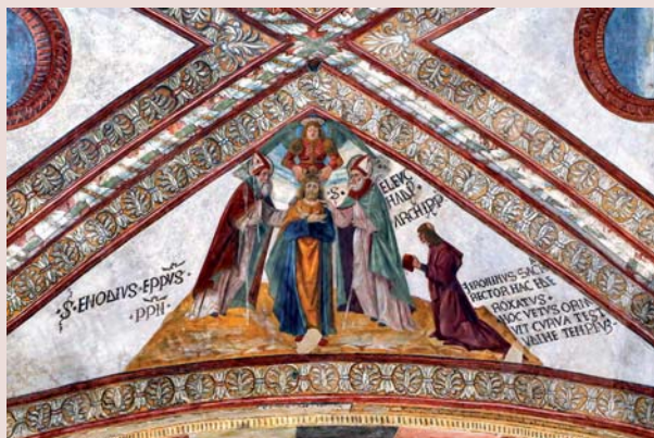
Incoronazione di Costantino - Volta restaurata